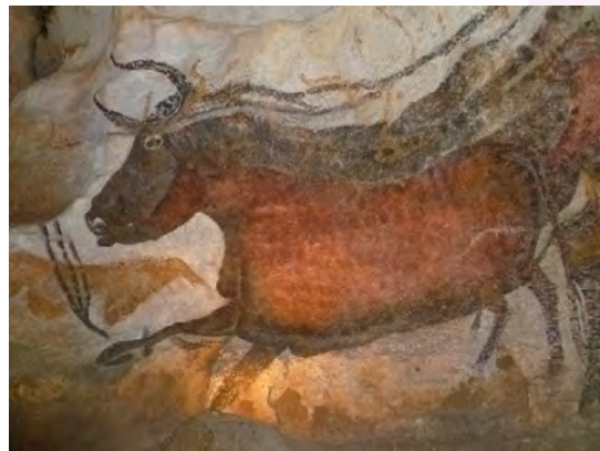
Intérieur de la grotte de Lascaux. Peinture rupestre préhistorique, par JoJan, 2021.