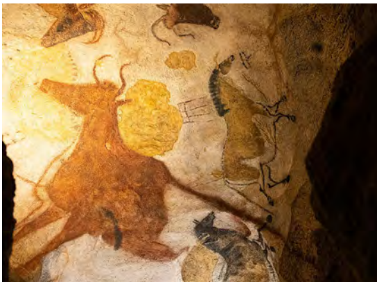
Lascaux II, par Elke Wetzig, 2023.