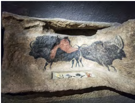
À l'intérieur de Lascaux 2, Montignac-Lascaux, par Raimond Spekking, 2023.