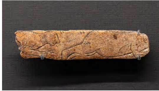
La poursuite amoureuse , grotte d'Isturitz, Pyrénées-Atlantiques, par Thilo Parg, 2023.