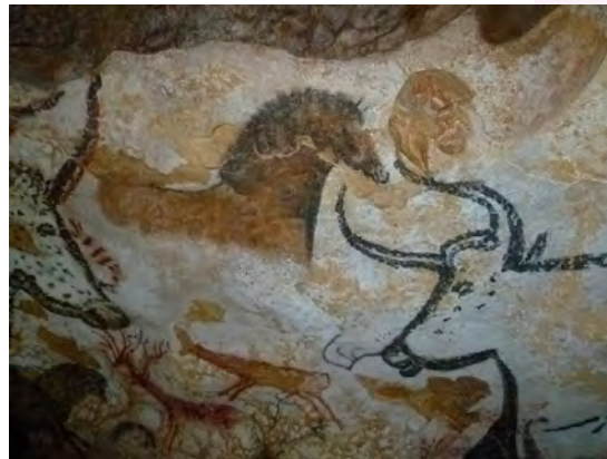
Intérieur de la grotte de Lascaux. Peinture rupestre préhistorique, par JoJan, 2021.