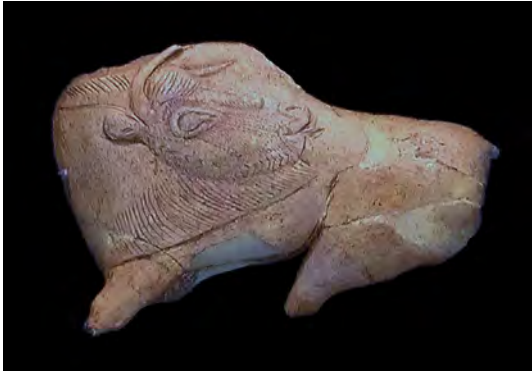
Bison léchant son flan , abri de la Madeleine, Dordogne, par Ethan Doyle White, 2013.