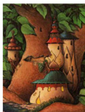
L'arbre sans fin

Une fois qu'on s'est tous mis d'accord, on ébauche le plan général (sur une feuille format raisin, par exemple). Puis chacun s'attribue une des pièces, la dessine et la fixe enfin sur le plan. Pour les plus grands, la maison peut même être conçue en volume !