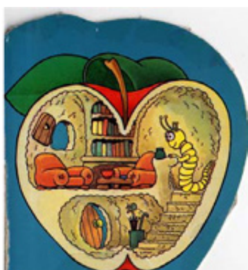
Dans la pomme

Aussi peut-on envisager de reconstituer cet intérieur en demandant aux enfants de nommer les différentes pièces – de la cave au grenier, en passant par la bibliothèque – que pourrait comporter cette maison-théière.