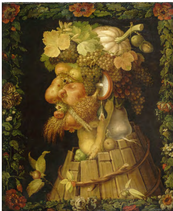
L'Automne , Giuseppe Arcimboldo, 1573.