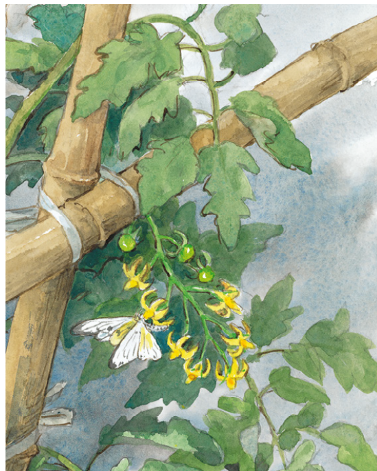
le plant est en fleur