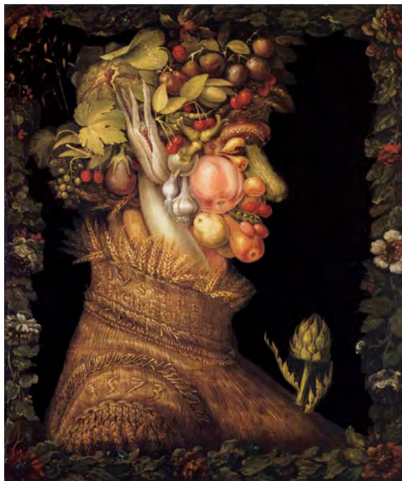
L'Été , Giuseppe Arcimboldo, 1573.