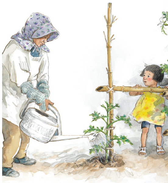
Grand-mère arrose, et le tuteur