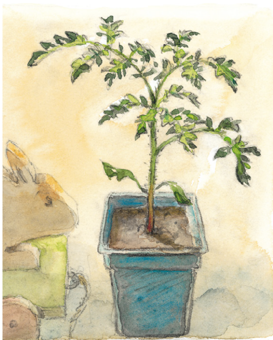
Plant dans son godet