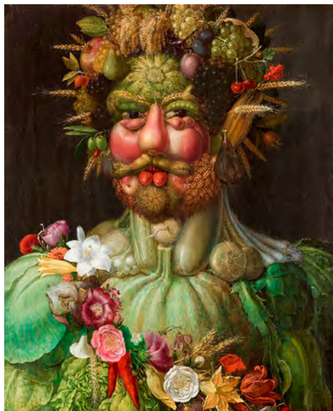
Vertumne , Giuseppe Arcimboldo, 1590.

Voir ici l'œuvre d'Arcimboldo , au complet, ainsi qu' une notice consacrée à l'artiste .