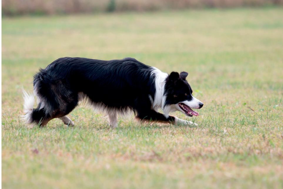
Le chien - par Jean-noelkern — Travail personnel, CC BY-SA 4.0.