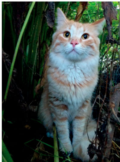
Le chat - par Rbreidbrown - Travail personnel, CC BY-SA 4.0.