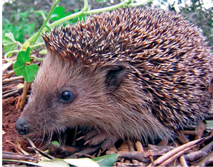
Un jeune hérisson - par Gibe, CC BY-SA 3.0.