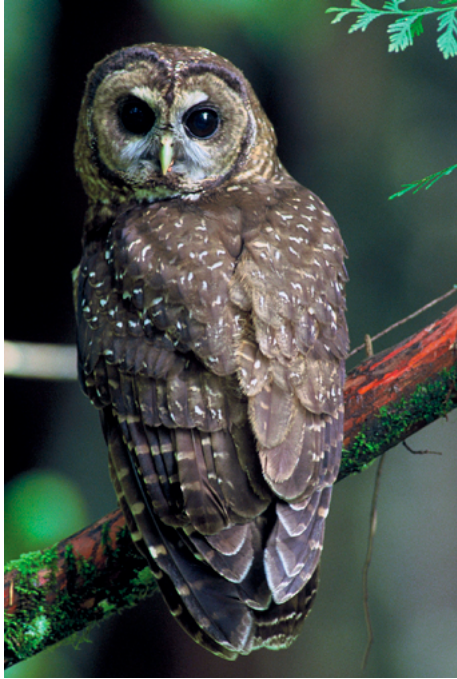
La chouette - par Hollingsworth, John and Karen; photo by USFS Region 5 (Pacific Southwest) — US Fish and Wildlife Service.