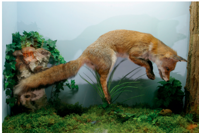
Renard roux empaillé dans la position qu'il utilise lorsqu'il mulote par Musées du Mans — Travail personnel, Domaine public