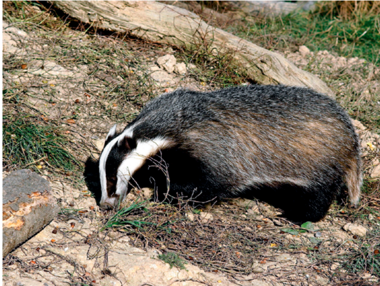
Le blaireau