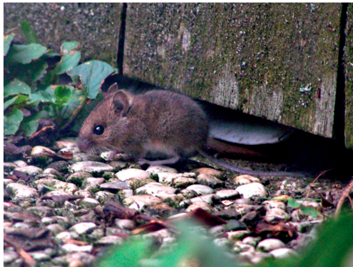
Un mulot