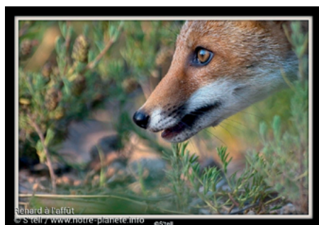
Renard à l'affût (Vulpes vulpes)

Il y a aussi cette photo de renard, qui ressemble trait pour trait au renard plongeant sa tête dans le terrier de Jules et qui montre ainsi que l'illustrateur a travaillé à partir de modèles réels.