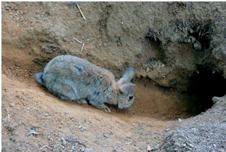
Lapin de garenne à l'entrée de son terrier par Frank Vincentz — Travail personnel, CC BY-SA 3.0.