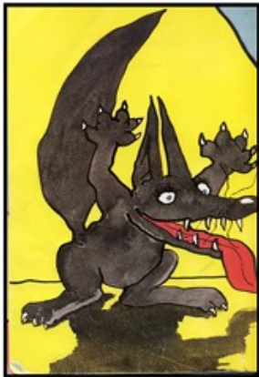
Loulou de Grégoire Solotareff

Découper chaque illustration de loup, de façon à avoir un jeu de cartes. Étaler les cartes et reconnaître le loup de Geoffroy de Pennart. Ces cartes peuvent ensuite être utilisées pour des ateliers de langage ou d'arts plastiques. Quel loup préfères-tu ?