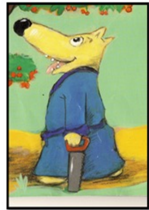
Le loup d'Alex Sanders