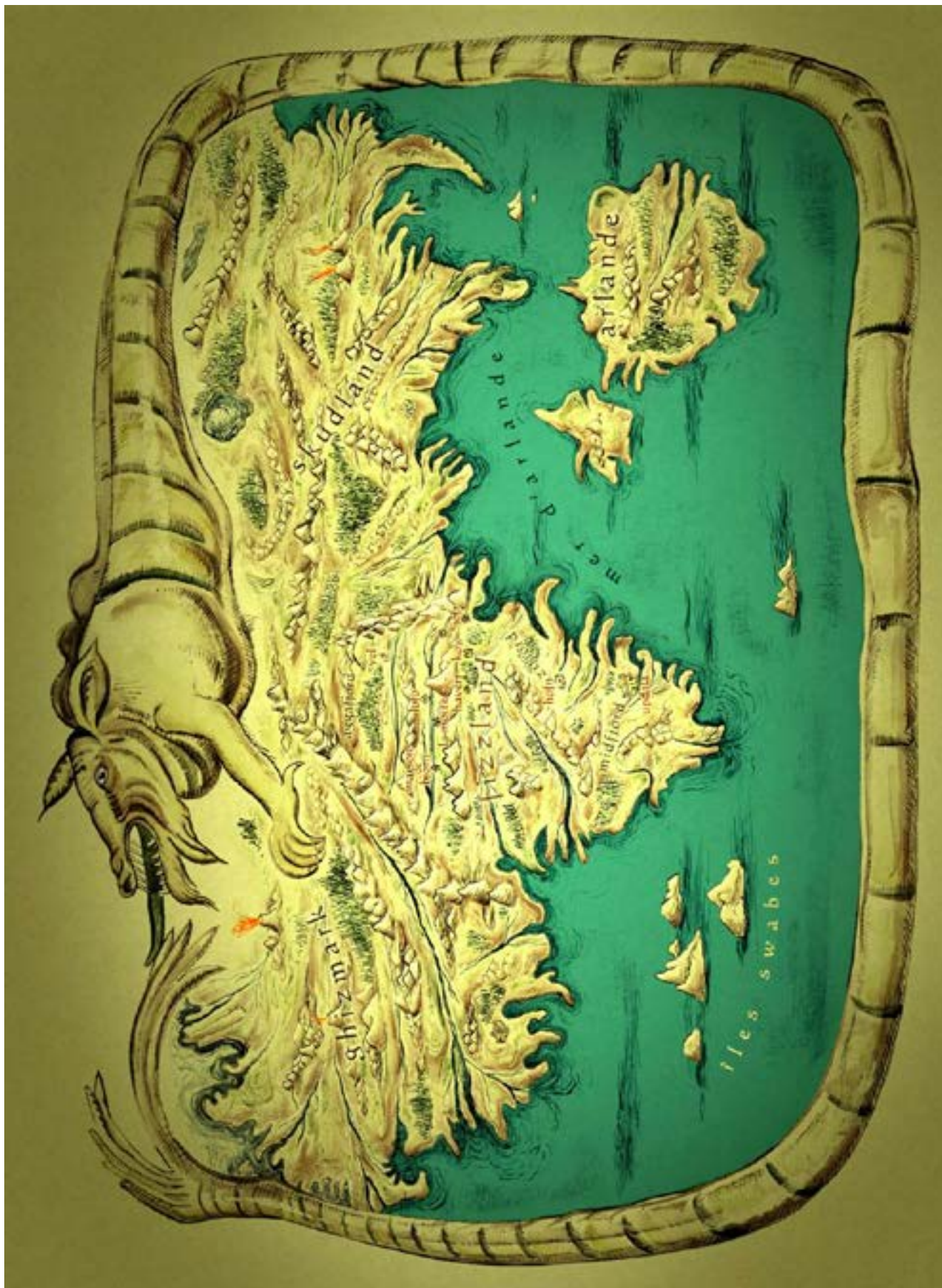
Bjorn le Morphir, Thomas Lavachery © l'école des loisirs