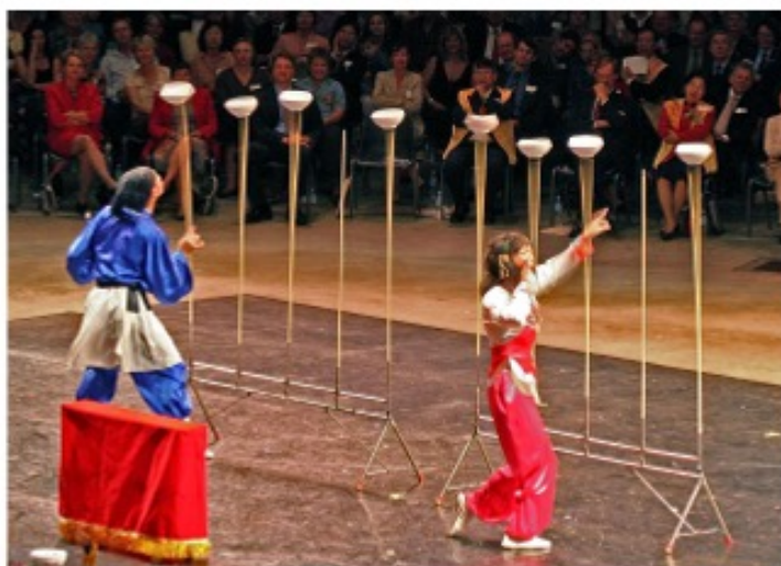
La jonglerie (assiettes tournantes)