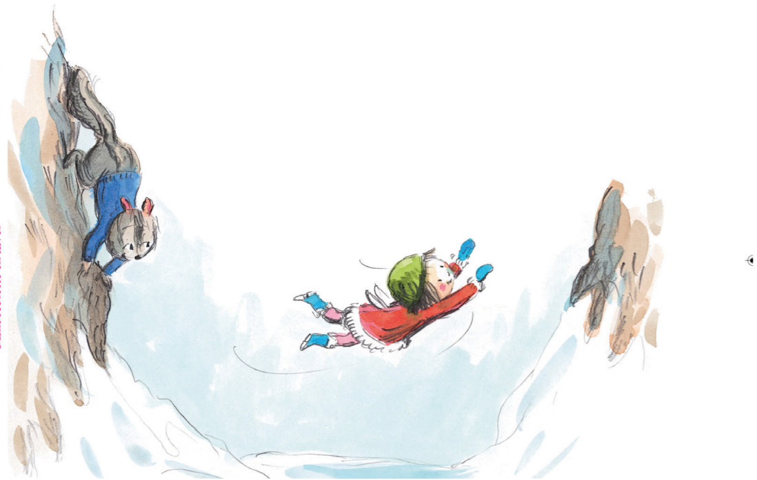
www.ecoledesloirsirsalecole.fr Minusculette en hiver - Kimiko & Christine Davenier

Faites alors découvrir les illustrations, les unes à la suite des autres, de la page 4 jusqu'à la page 21, en laissant à chaque fois un petit temps d'observation et de description. A la fin de cette observation fine, laissez chaque groupe s'exprimer et vous dicter l'histoire qu'ils imaginent. S'ils en ont le besoin, guidez-les avec quelques questions : Quel est l'animal sur la couverture ? Que semble-t-il faire ? Que fait la petite fille ? Est-ce une petite fille ? Qu'a-t-elle dans son dos ?